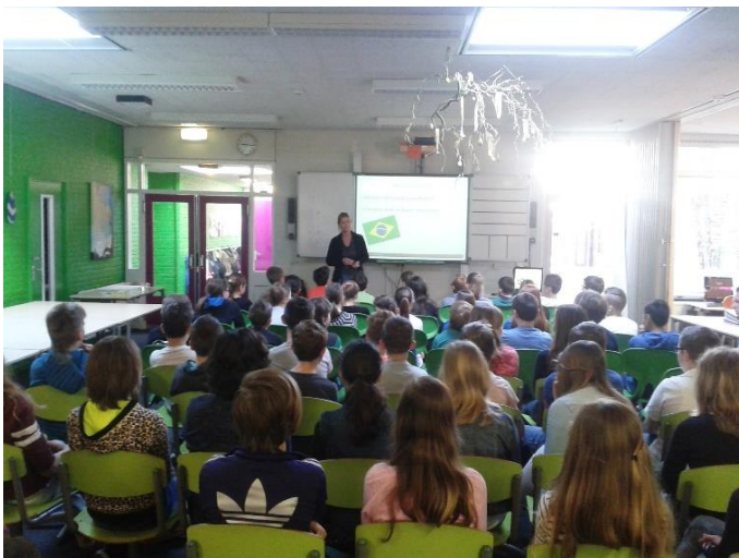
Presentatie voor Basisschool De Avonturijn in Urmond.

In juni 2014 loopt in principe de tweejarige bestuursperiode van de bestuursleden af. Gelukkig hebben alle vijf de leden aangegeven bestuurslid te willen blijven.