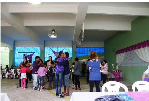
Vrouwen en kinderen aan het dansen.

De maand mei staat in Brazilië min of meer geheel in het teken van Moederdag. De realiteit is dat veel van de kinderen in Alvorada niet (meer) bij hun eigen moeder wonen. Dit kan pijnlijke situaties opleveren en daarom spreken en vieren we in het centrum niet Moederdag, maar Vrouwendag. De kinderen mogen zelf kiezen wie de belangrijkste vrouw in hun leven is. Dat kan hun moeder zijn, maar ook een oma, tante, zus of vriendin. Zaterdag 17 mei was er voor al deze vrouwen een speciale middag georganiseerd in het centrum. Samen met de kinderen hebben de vrouwen o.a. capoeira en dansles gekregen.