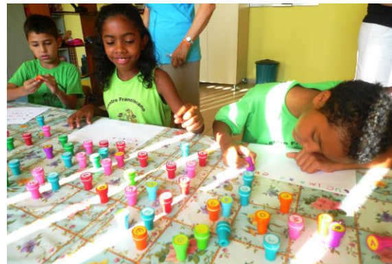
Vanuit Nederland ontvingen we letterstempels. De meerderheid van de kinderen tussen de 6 en 10 jaar kan niet of niet goed schrijven. Met de stempels leren ze dit op een speelse en creatieve manier.