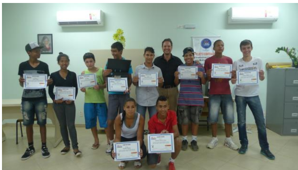
Jongeren die in 2014 het certificaat van de Microsoft Office 2013 basiscursus ontvingen.

Beheer van het inkomen Besteding van het inkomen Beloningsbeleid