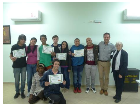
Jongeren die in 2015 het certificaat van de Microsoft Office 2013 cursus voor gevorderden ontvingen.

SOLidariidade zet zich in voor de toekomst van jongeren in Brazilië